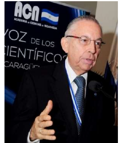
Dr. Carlos Tünnermann Bernheim

El Dr. Tünnermann fue uno de los actores de la sociedad civil que imputó al presidente Ortega durante la inauguración del Dialogo Nacional: “don Daniel Ortega, su discurso ha sido decepcionante porque usted no trajo aquí un mensaje de paz”, señaló el académico; quien también demandó el cese inmediato a la represión policial y el desarme a las fuerzas de choque afines al Gobierno. “Dé la orden como jefe supremo de la Policía”, sentenció. Igualmente, ha sido un férreo promotor de la propuesta de la Alianza Cívica por la Justicia y la Democracia de que el Gobierno nicaragüense invite a la Comisión Interamericana de Derechos Humanos, al Alto Comisionado de las Naciones Unidas y a representantes de la Unión Europea para que realicen visitas de urgencia al país en las que se evalúe el estado de violación de Derechos Humanos.